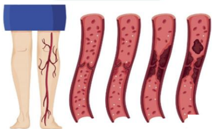
ترومبوز ورید عمقی